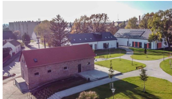
Magtár és a Szolgáltatóház